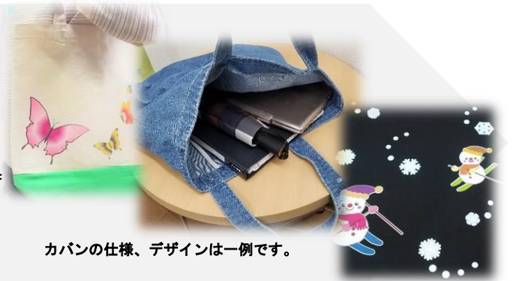
カバンの仕様、デザインは一例です。

別途、オリジナルのイラストや写真を持ち込んでいただいてもかまいません。お気軽にお問合せください。